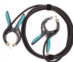
Cable de conexión de corriente con pinzas TTA