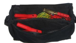
Bolsa para cables