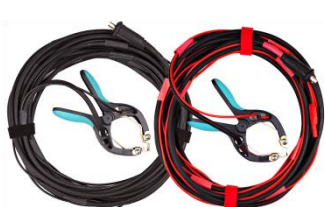
Cables de corriente y tensión con pinzas TTA

Todas estas especificaciones son válidas para una temperatura ambiente de +25 °C y con los accesorios recomendados. Las especificaciones están sujetas a cambio sin previo aviso. Las especificaciones son válidas si el equipo se utiliza con el conjunto de accesorios recomendado.