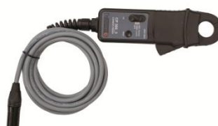
Pinza de corriente 30/300 A con extensión de 5 m