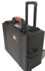
Maleta de plástico para cables con ruedas