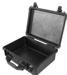
Maleta de plástico para cables