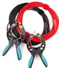
Cables de tensión con pinzas TTA